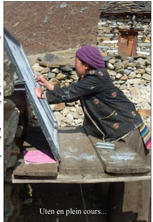
Uten en plein cours...

Il s'agit d'un projet étroitement lié à la construction de la pièce des femmes pour le tissage , puisque les nouveaux locaux seraient partagés ; le financement est a priori assuré par le Comité des Femmes, mais l'association tient à superviser ce projet, dans la mesure où il devra être suivi d'une formation des femmes à la couture, et de l'achat d'une machine à coudre.