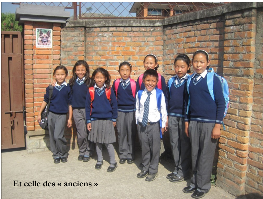
Et celle des « anciens »

Finalement le tuteur nous fiche gentiment dehors à la nuit tombée : Uten et moi sommes un peu tristes, les enfants nous font de grands signes de la main, ils ont l'air heureux d'être là, ensemble, et c'est moins dur de les quitter ainsi.