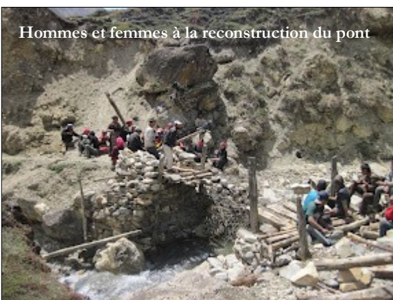
Hommes et femmes à la reconstruction du pont