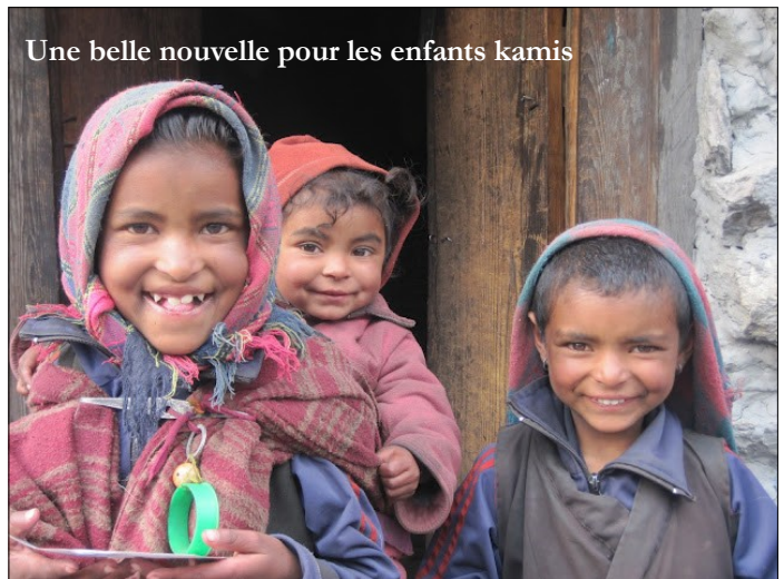
Une belle nouvelle pour les enfants kamis

Cette année, les alpinistes repartent très tôt du Manaslu, peu de réussites. Trop de neige. Quelques retardataires errent encore dans Samagaon.