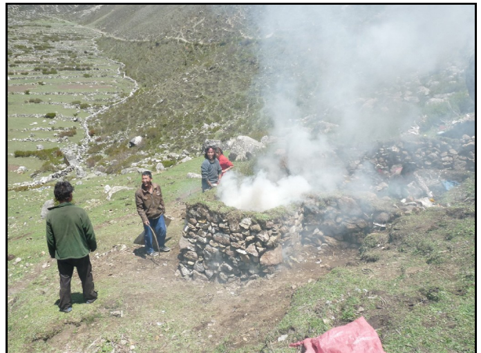
Les débuts prometteurs de l'incinérateur...

A la faveur de la discussion, il apparaît qu'un tel dispositif peut également être initié de la même façon pour la constitution d'un fonds de secours, d'autant que le concept de Community Base Organization (CBO) existent déjà au Népal et peuvent servir de base administrative au comité de gestion de ce fonds.