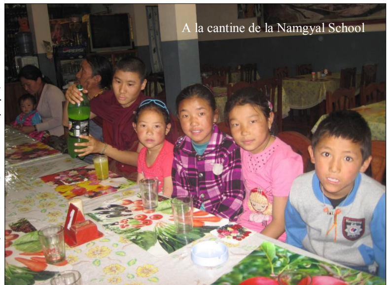
A la cantine de la Namgyal School