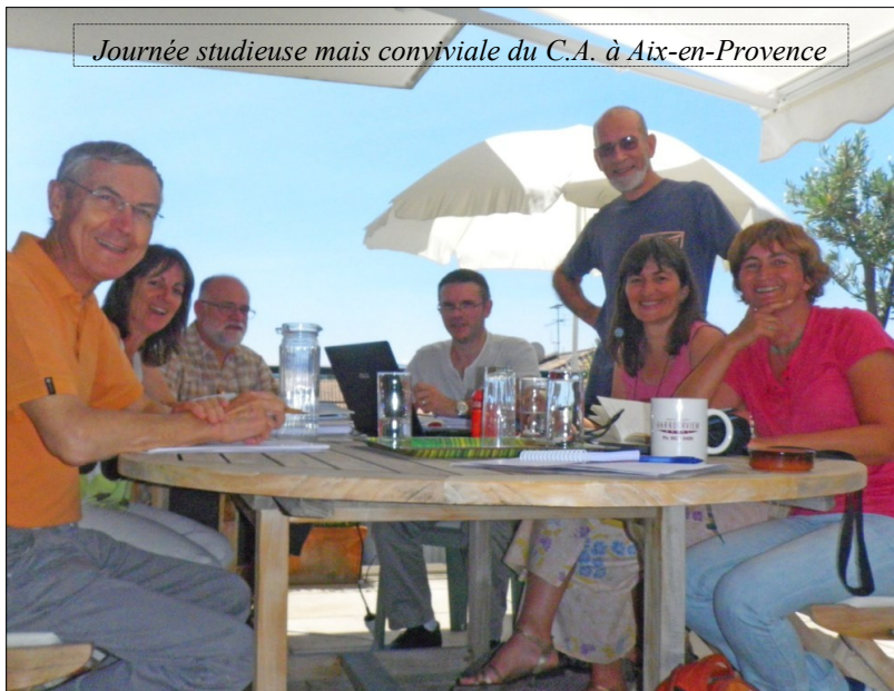
Journée studieuse mais conviviale du C.A. à Aix-en-Provence

... Et à toutes les personnes non citées qui, par leurs diverses actions, ont soutenu et soutiennent nos projets !