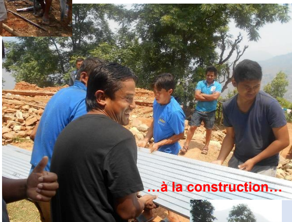
...à la construction...