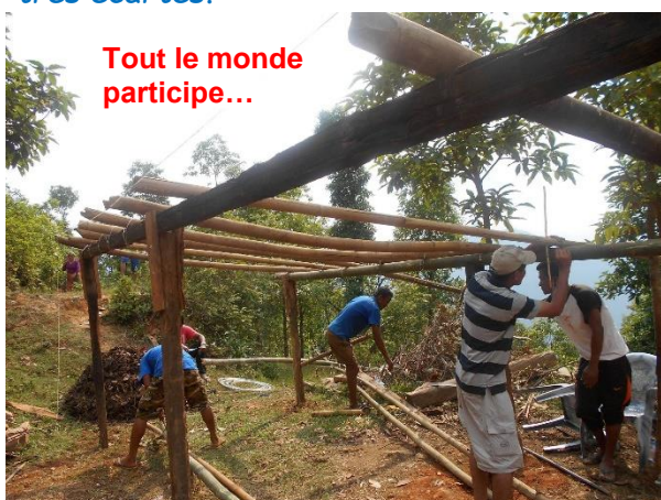
Tout le monde participe...