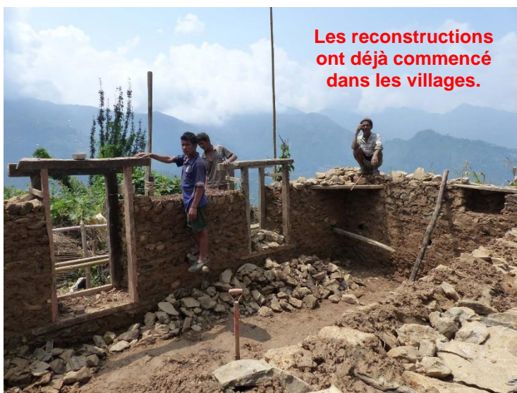
Les reconstructions ont déjà commencé dans les villages.

Dans chacun des villages où nous interviendrons, le chef ou le comité de village devra désigner un maître d'ouvrage. Celui-ci sera le représentant du village, interlocuteur de tous les intervenants. Il veillera au bon déroulement des opérations et devra obtenir l'accord des propriétaires sur les travaux envisagés et les autorisations de travaux nécessaires.