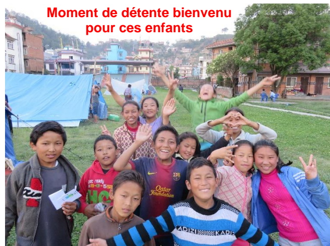
Moment de détente bienvenu pour ces enfants

Le 1 er mai, les nouvelles sont plus précises : Catherine et ses proches dorment sous la tente car