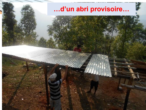
...d'un abri provisoire...