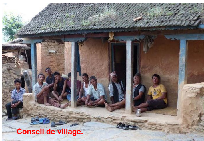
Conseil de village.

Nous allons maintenant nous engager dans la deuxième phase : reconstruire les maisons qui ont été détruites et consolider celles qui sont restées debout, sans être habitables en l'état.